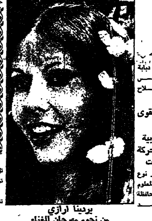
يودينا آرازي من نجوم مهرجان الغناء